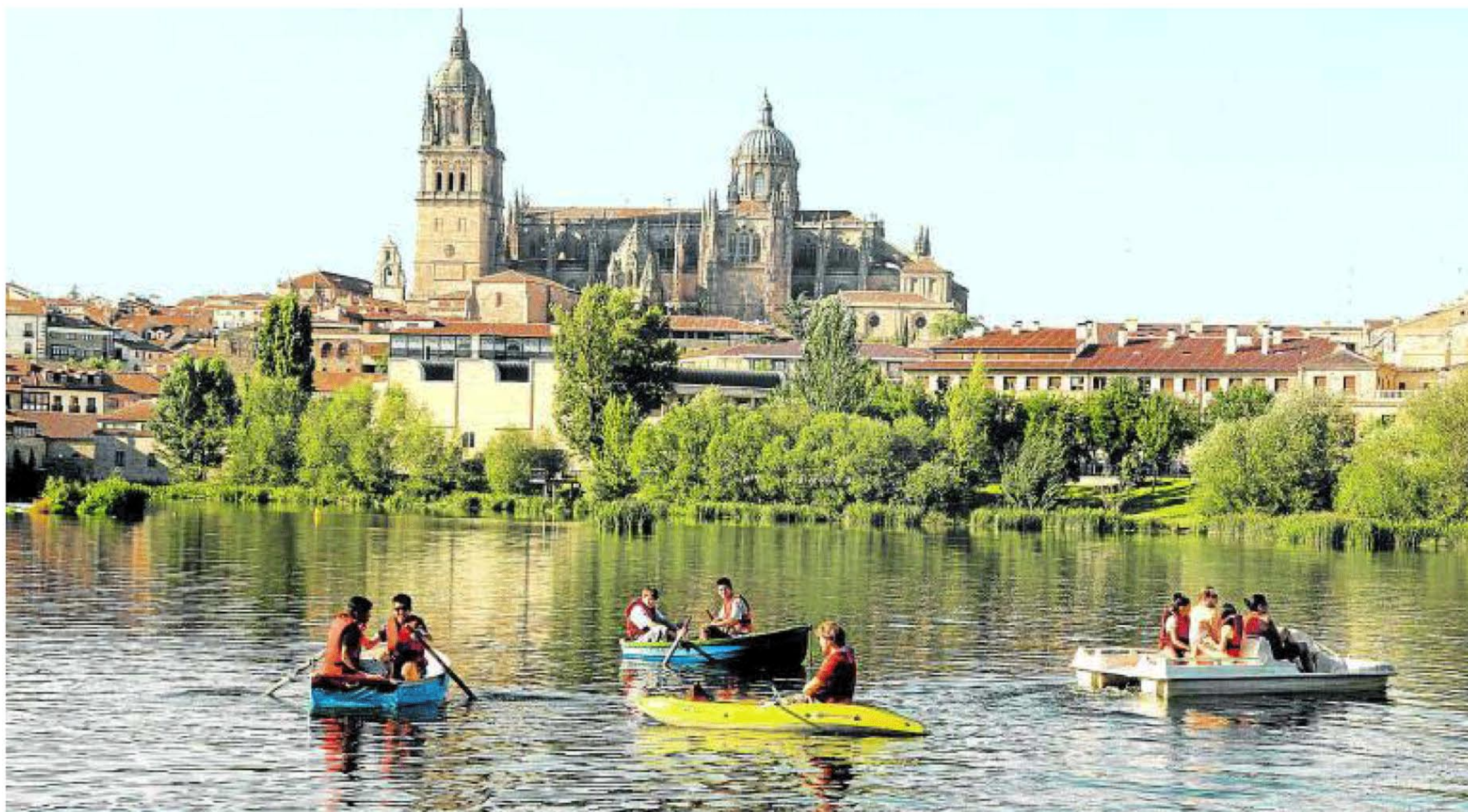
Espectaculares vistas de las dos catedrales y la Clerecía desde el río Tormes subidos a barcas remos, pedales y kayak.