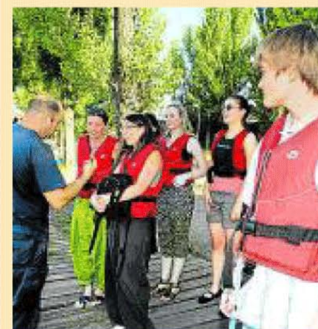
Recibiendo las indicaciones.

■ HORARIOS. Desde las 11.00 de la mañana hasta las 21.30 se pueden ir a alquilar las barquitas, por lo que el horario es bastante amplio. El embarcadero están abiertas todos los días desde abril hasta septiembre, aunque siempre depende del tiempo, ya que hay temporadas que se pueden alargar 15 o 20 días si las condiciones meteorológicas son favorables.