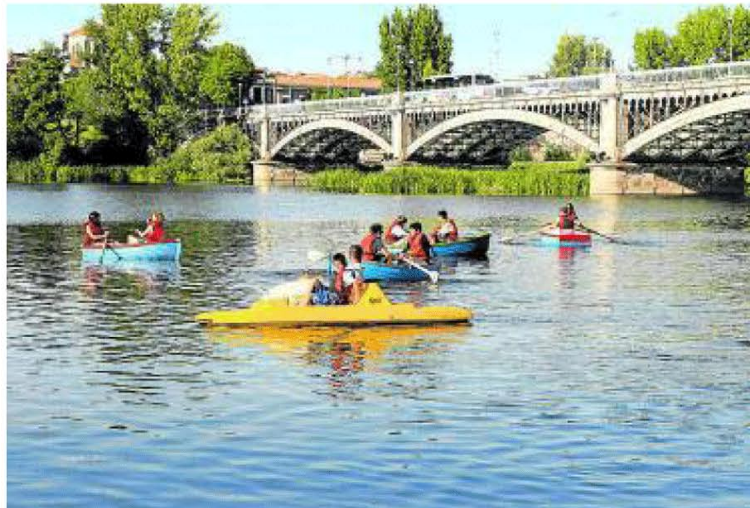
Remando por el río Tormes con el puente Enrique Estevan de fondo.

El embarcadero cuenta con barcas de pedales, canoas, kayaks y barcas de remos para salir a navegar por el río